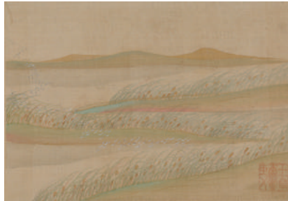
《青緑山水面帖》池大雅 一帖 江戸時代(宝暦13年(1763)) ※前期・後期で頁替え