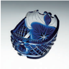
《薩摩切子 藍色被船形鉢》一口 江戸時代後期(19世紀中頃)