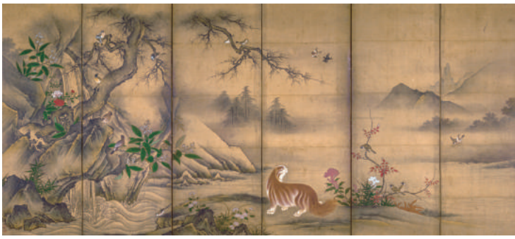
《樹下麝香猫図屏風》伝 狩野雅楽助之信 六曲一隻 室町時代(16世紀) ※後期展示

東京・六本木にあるサントリー美術館は、60年を越える歴史を持ち、多くの人々に親しまれています。「生活の中の美」という基本理念のもと収集されたコレクションは、実用的な性格を持ちながらも精緻で目映いばかりの美しさに満ちており、絵画・陶磁・漆工・染織など日本の古美術から東西のガラスまで、国宝・重要文化財を含む約3000件に及びます。本展では、そのコレクションから選りすぐりの優品約50件をご紹介します。秋田にゆかりの深い《佐竹本・三十六歌仙絵源順》(重要文化財)をはじめ、池大雅や円山応挙といった江戸時代に活躍した著名な絵師たちによる絵画、さらにはフランスのエミール・ガレによるガラス工芸など、サントリー美術館が所蔵する珠玉の名品をこの機会にぜひご覧ください。