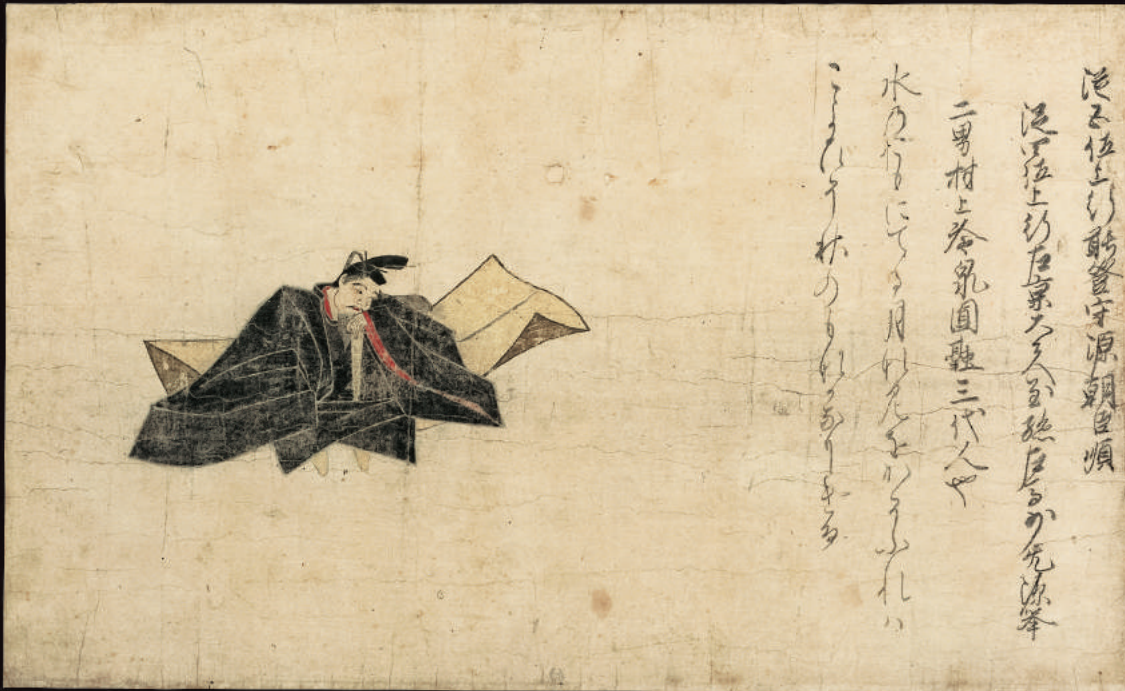
《佐竹本・三十六歌仙絵 源順》 画/伝 藤原信実 書/伝 後京極良経(重要文化財) 一幅 鎌倉時代 13世紀 サントリー美術館