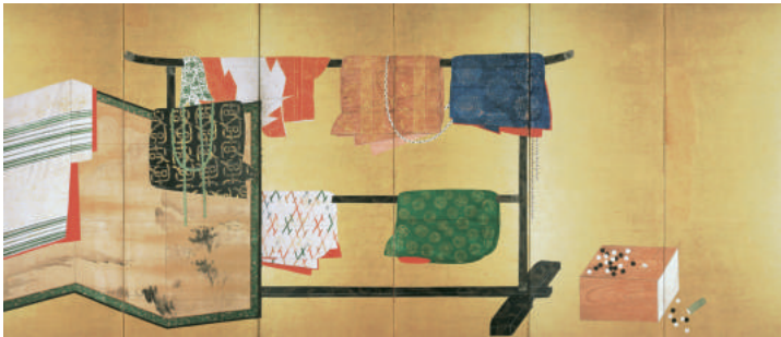
《誰が袖図屏風》六曲一双 江戸時代(17世紀) ※前期展示