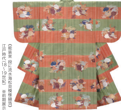
《能装束 段に流水海松貝模様縫道》 江戸時代(18~19世紀) ※前期展示