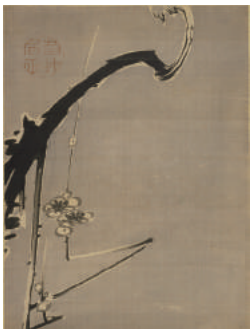
《棲鸞園画帖》のうち伊藤若冲《墨梅図》一帖 江戸時代(天明7年(1787)跋) ※後期展示