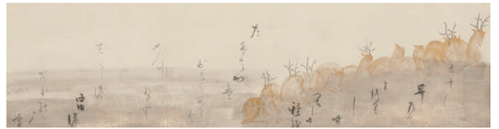
《鹿下絵新古今集和歌巻断簡》書/本阿弥光悦 画/俵屋宗達 一幅 桃山時代(17世紀前半) ※前期展示