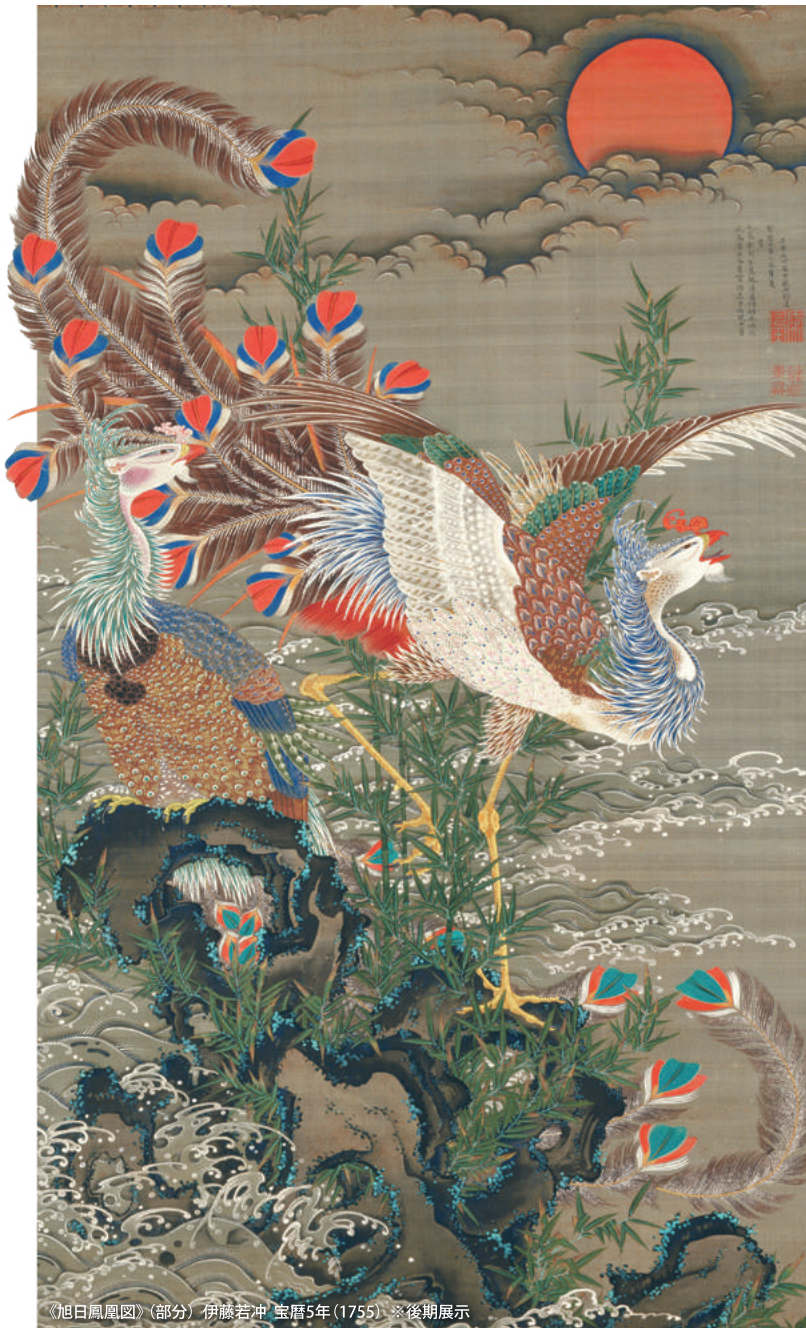
《旭日鳳凰図》(部分) 伊藤若冲 宝暦5年(1755) ※後期展示