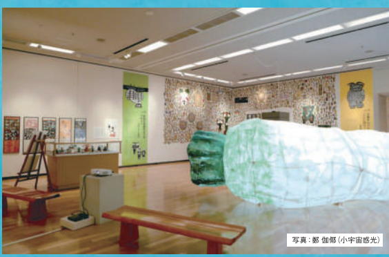
令和5年度『みんなのキンビ』プロジェクト第1弾「大根ビネーション展」の様子

※『キンビコミュニケーター』は、秋田にくらす人やテーマと結びつきながら、アートを通して生まれるコミュニケーションを大切に、人と人、人と地域をつなぐ存在です。令和6年度は高校生から70代までの23名が、「誰もが美術館で楽しむためには」をテーマに熟議を重ね、本展ワークショップを企画しました。