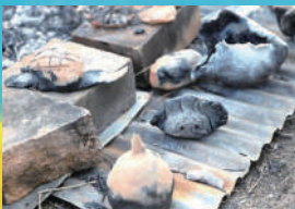
様々な体験と交流の場「キンビ美術部」