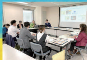
「不忍池園」鑑賞支援ツールの検討