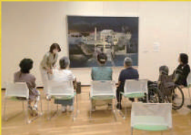
「高齢者×アート×MUSEUM」をテーマとした絵画鑑賞プログラム