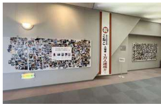
▲みなさんの「うちのネコ」ベストショットがズラリと並びました！