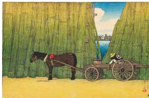
▲川瀬巴水《東京十二題 こま形河岸》 大正8年(1919)