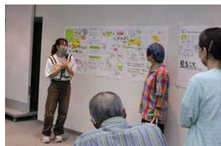
▲第3回キンビコミュニケーター講座 「まなぶ アートコミュニケーションについて知ろう」