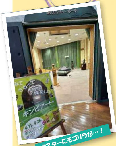
ポスターにもゴリラが…!