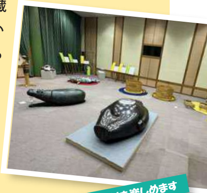
彫刻や木の質感の違いも楽しめます