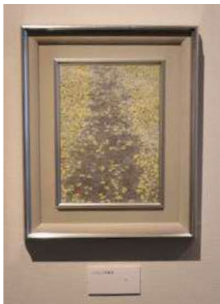
《いちょう落ち葉道》

今回の展覧会では、日本画教室で使った技法“揉み紙”(和紙を揉んでシワを作る技法)で描いた作品をはじめ、凍った波紋が残る湖、イチョウの落ち葉で覆われた道、