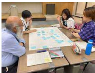
▲第1回キンビコミュニケーター講座 「キックオフイベント キンビコミュニケーターって何をするの?」