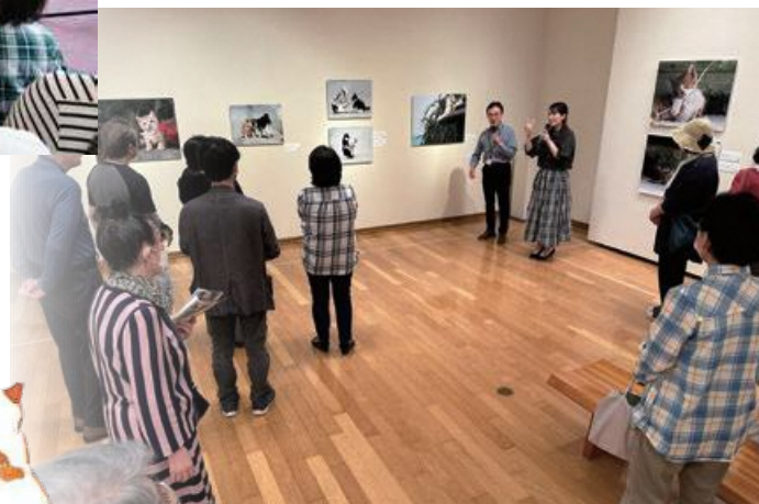
▲ABSアナウンサーと担当学芸員によるギャラリートーク