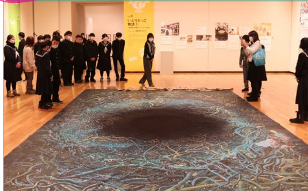
「みんなのキンビ」大根ビネーション展 鑑賞の様子(R5年)

学校の授業の一環として、当館の各種プログラムを無料でご利用いただくことができます。展覧会の鑑賞、館内探検等のメニューをご用意しています。幼稚園・認定こども園、保育所、小・中学校、特別支援学校、高等学校等に対応しています。保育園や部活動等についてもご相談ください。「実物との出会い」、「創作活動へのアプローチ」を支援します。