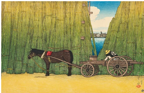
川瀬巴水《東京十二題 こま形河岸》大正8年(1919) 渡邊木版美術画館蔵

伝統的な浮世絵木版技術を用い、高い芸術性を意識した「新版画」は、大正から昭和にかけて国内外で人気を呼びました。その瑞々しい情趣や清新な感覚は、今なお我々を魅了して止みません。本展では、新版画を牽引し世に広めた版元・渡邊庄三郎の挑戦の軌跡をたどりつつ、伊東深水や川瀬巴水らの希少な初摺を通して、新版画の魅力をご紹介します。【関連イベント】ギャラリートーク等