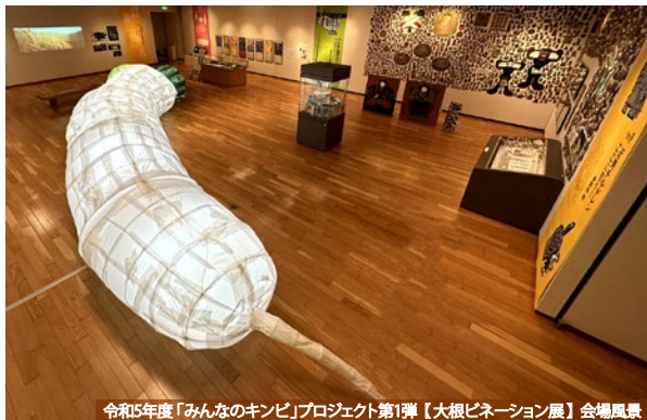
令和5年度「みんなのキンピ」プロジェクト第1弾【大根ピネーション展】会場風景

「みんなのキンピ」プロジェクトは、社会包摂への意識の醸成や美術館がコミュニティとしての役割を担うことを目指す取組です。その成果展として開催する本展の今年度のテーマは「いっしょにつくる」。年齢も暮らし方も異なる人たちがアートを介することで出会い、対話し、つながることで生まれる作品にご期待ください。【関連イベント】ギャラリートーク等