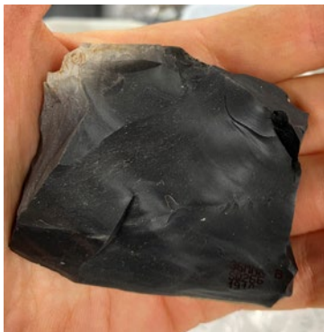
石器(剥片) 秋田県埋蔵文化財センター蔵